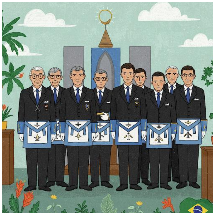
Imagem em "Art Naif"